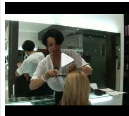
Luce un peinado de estrella con peluquería Marta G